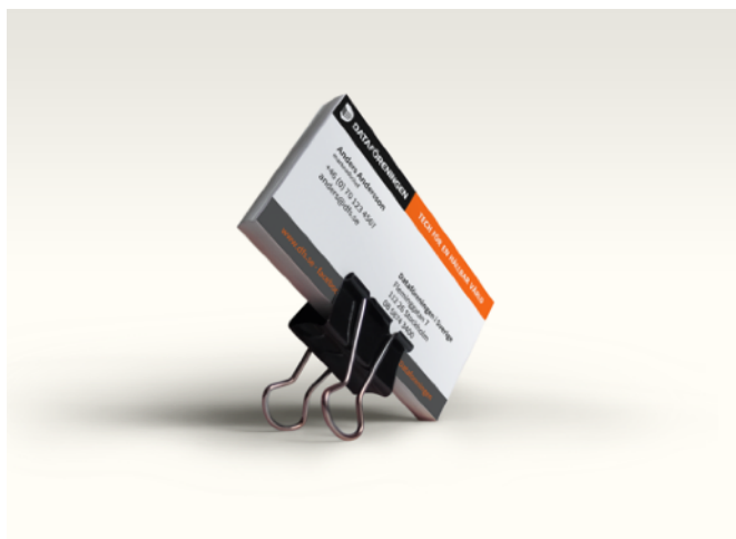
Designprogrammet applicerat på visitkort

Några mallar för program som skapar trycksaksoriginal finns inte skapade. När du arbetar i dessa program använd rätt typsnitt, rätt färger och tänk på att god formgivning handlar om att förvalta luften i formgivningen. Bli det för tätt mellan objekten är det antingen fel på format, storlekar eller omfång.