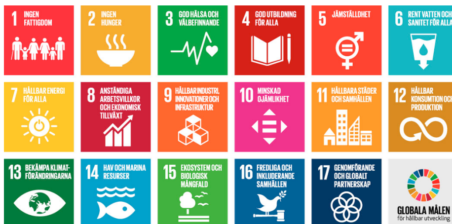
Figur 1 Agenda 2030 – 17 Globala mål för hållbar utveckling som världens länder förbundit sig att uppnå 2030. FN's deklaration om mänskliga rättigheter finns integrerade i målen.

Vidare pekar rådet på att digitaliseringens möjligheter och utmaningar är gemensamma och utbyte av kunskap, expertis och teknik beskrivs som en viktig komponent för att skapa förutsättningar för en hållbar utveckling och genomförandet av Agenda 2030.